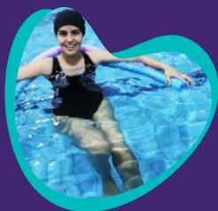
Centro de Terapias Naturais Fonte de Vida