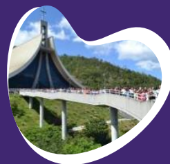
Santuário Santa Paulina