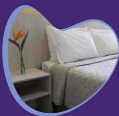
CEIC Pousada & Eventos